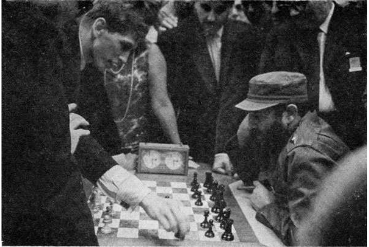
Fischer-Castro ile ma yaparken

Bir Rus şöyle demiştir. Spassky 'yi anlayabilmek için en sevdiği romancının Dostoyevski, en sevdiği bestecinin de Scriabin olduğunu bilmeniz gerekir. Buna karşılık Fischer'in herhangi bir klasik besteciye sevdiği duymamıştır. Ya en çok sevdiği yazar?Amerikalı oyuncunun elinde, satran konulu dergi ve gazeteler dışında bir şey görülemezdi. Zaten liseyi de yarıda bıraktığı zaman şöyle demişti " Okulda öğrenilenler benim işime yarayacak şeyler değildi. Büyük usta Evans "Fischer'in diğer oyuncularından ayıran özelliği, satran uğruna özel hayatını feda edebilmesi"diyerek açıklar.