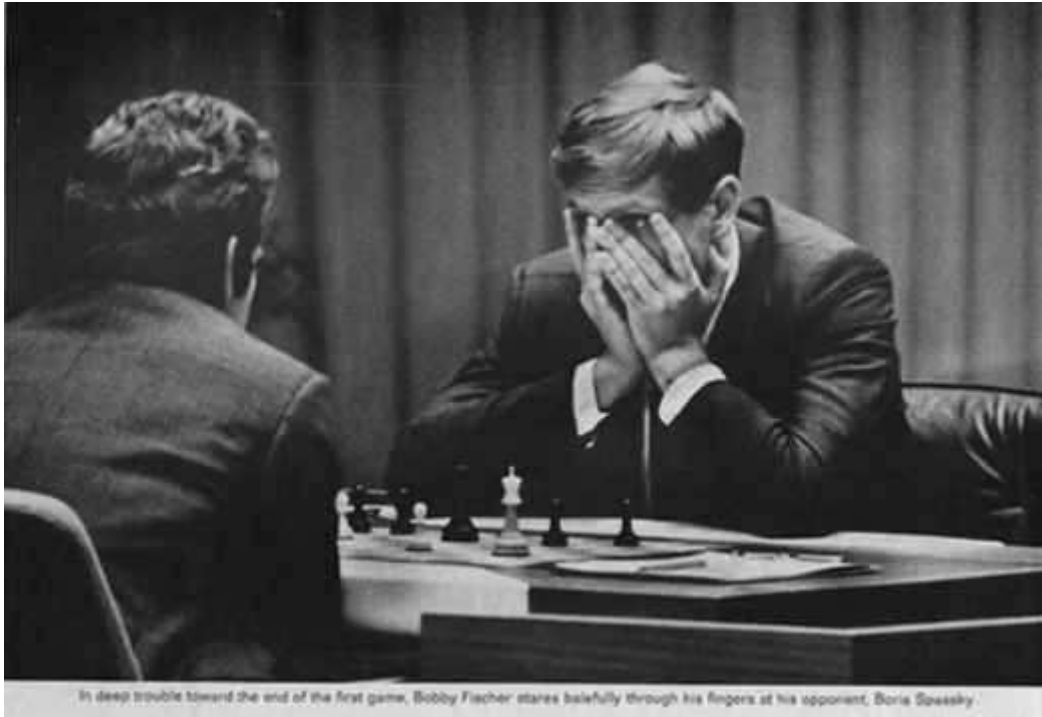
In deep trouble toward the end of the first game, Bobby Fischer stares balefully through his fingers at his opponent, Boris Spassky.

geldiğinde Fischer'i kimse görmemişti. Fischer turnuvaya gelmemiş erteleme isteğini Fide başkanı'na iletmişti. Son bir kez daha bunu kabul eden Fide başkanı maçı hiçbir zaman oynanamayacağını düşünüyordu. Son anda bir İngiliz bankacı ek parayı verdi ve ödül 250.000 dolara yükseltildi Sonunda 11 Temmuz 1972 yılında maç başladı. . Bu Fischer'in büyük eleştiriler gelmesine sebep oldu. Nasıl olur da parayı satranca değişir bu oyuna leke getirirdi. Ama Fischer'in bu inatçı istekleri olmasa bugün hiçbir oyuncu büyük paralarla karşılaşamaz ve Dünya Şampiyonu olmasına rağmen beş parasız ölen ilk Dünya Şampiyonu Wilhelm Steiniz 'in durumuna düşerdi. Bugün Fischer sayesinde dünyadaki bütün oyuncular çok daha fazla para kazanıyor, hayatını rahat bir şekilde sadece satranç oynayarak geçindiriyor, satranç öğretmenleri ders ücretlerini alarak hayatını kazanıyor. . Fischer daha sonra yapacağı hareketlerle cebine para atmaktan başka bir şey düşünmediği eleştirisini tamamen haksız çıkaracaktı.